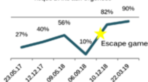
Taux de traçabilité du dépistage du risque BHRé aux Urgences